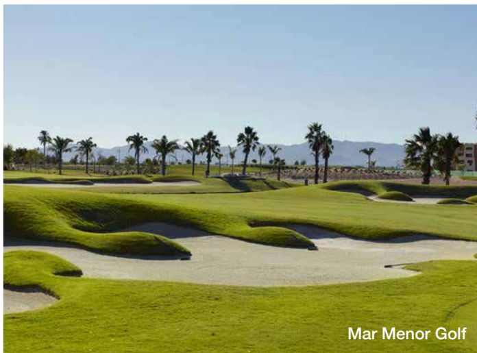
Mar Menor Golf