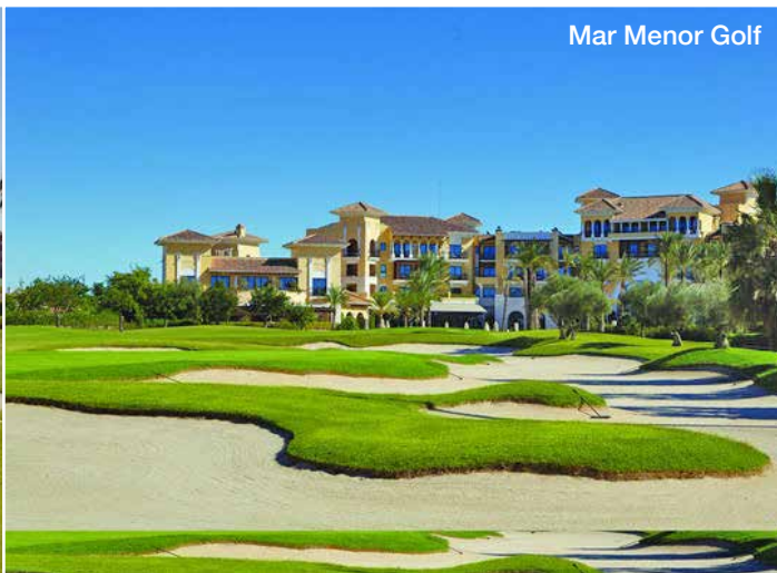
Mar Menor Golf